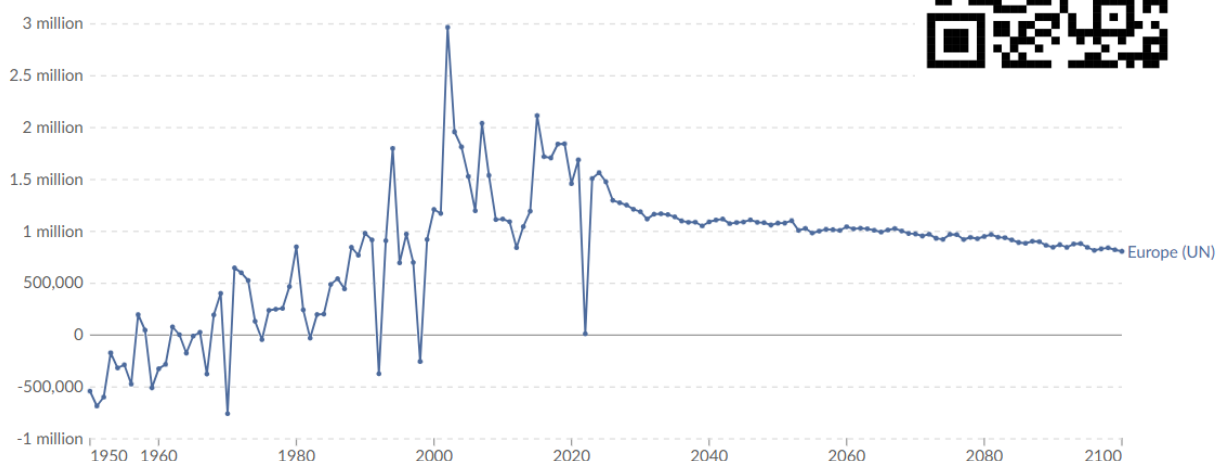
Migrační saldo celé Evropy od roku 1950 s předpovědí do roku 2100