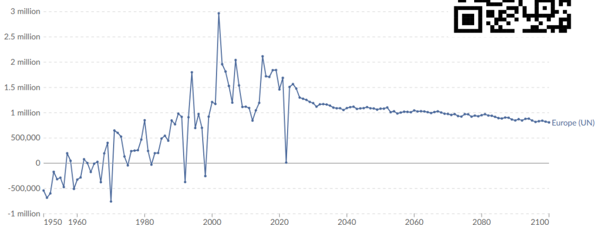
Migrační saldo celé Evropy od roku 1950 s předpovědí do roku 2100