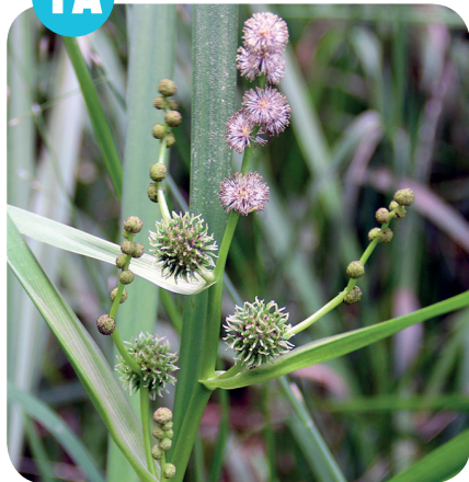
ZEVAR VZPŘÍMENÝ ( Sparganium erectum ) Zevarovité ( Sparganiaceae )