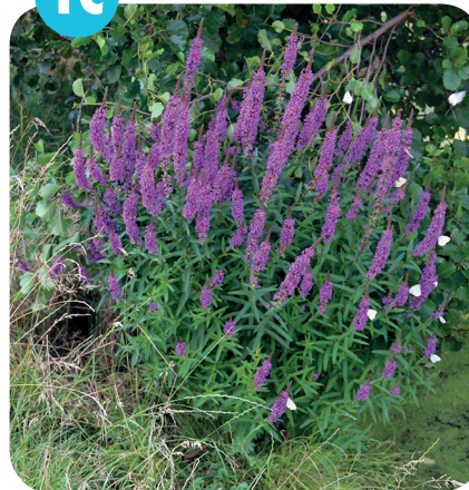
KYPREJ VRBICE ( Lythrum salicaria ) Kyprejovité ( Lythraceae )

Pobřežní křoviny, mokré louky a příkopy.