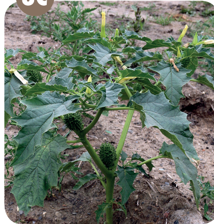
DURMAN OBEČNÝ ( Datura stramonium ) Lilkovité ( Solanaceae )