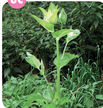
PCHÁČ ZELINNÝ ( Cirsium oleraceum ) Hvězdicovité ( Asteraceae )