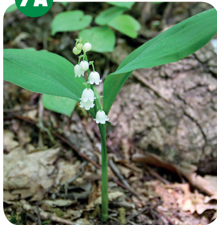
KONVALINKA VONNÁ ( Convallaria majalis ) Konvalinkovité ( Convallariaceae )

Světlé listnaté a smíšené lesy, křoviny, lužní lesy, horské nivy.