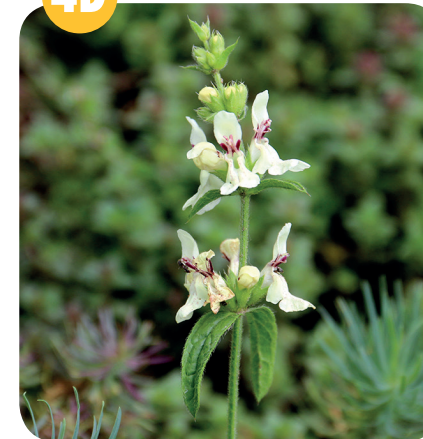
ČISTEC PŘÍMÝ ( Stachys recta ) Hluchavkovité ( Lamiaceae )

Výslunné stráně, skalní stepi, lesostepi, lesní lemy, řídké bory.