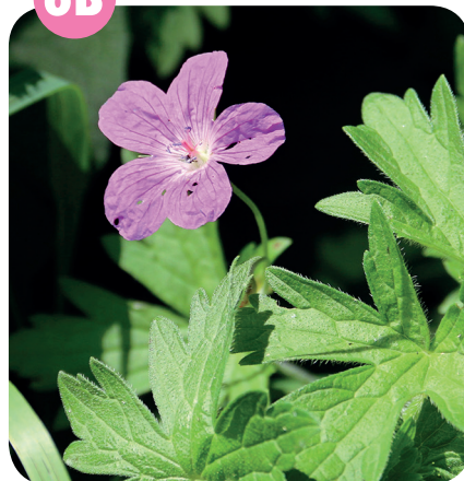
KAKOST BAHENNÍ ( Geranium palustre ) Kakostovité ( Geraniaceae )

Mokrě vysokostébelnaté louky, lužní lesy, břehy vod.