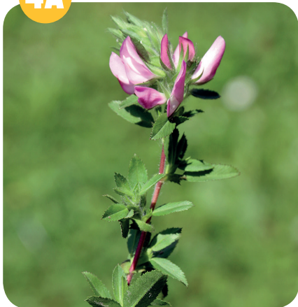
JEHLICE ROLNÍ ( Ononis arvensis ) Bobovité ( Fabaceae )