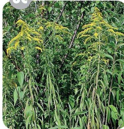
ZLATOBÝL KANADSKÝ ( Solidago canadensis ) Hvězdicovité ( Asteraceae )