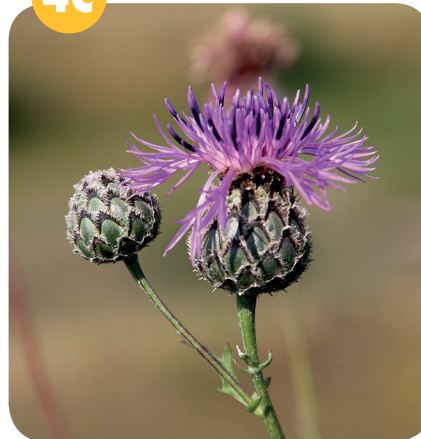
CHRPA ČEKÁNEK ( Centaurea scabiosa ) Hvězdicovité ( Asteraceae )

Křovinaté stráně, lesostepi, meze, sušší louky, lesní okraje.