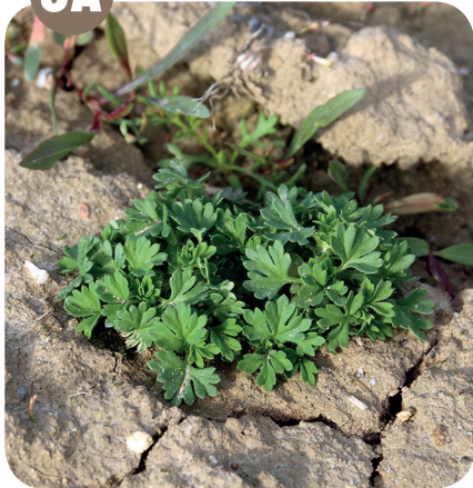
NEPATRNEC ROLNÍ ( Aphanes arvensis ) Růžovité ( Rosaceae )