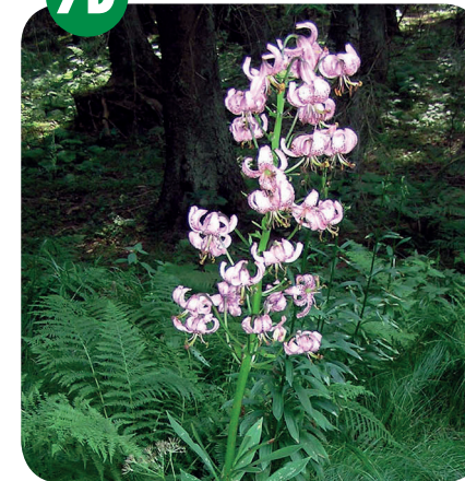
LILIE ZLATOHLAVÁ ( Lilium martagon ) Liliovité ( Liliaceae )

Listnaté a smíšené lesy, křoviny, vlhčí horské louky a nivy.