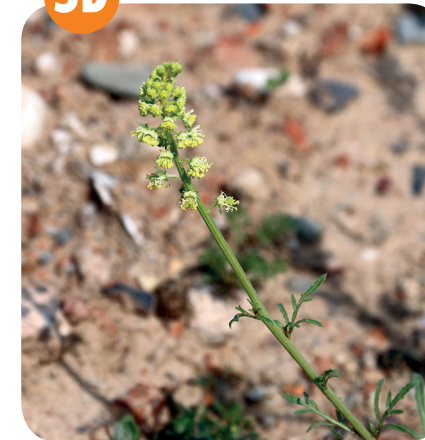
RÝT ŽLUTÝ ( Reseda lutea ) Rýtovité ( Resedaceae )