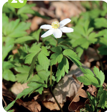
SASANKA HAJNÍ ( Anemone nemorosa ) Pryskvřnikovité ( Ranunculaceae )

Listnaté a smíšené lesy, vlhčí sečené louky, pastviny, sady.