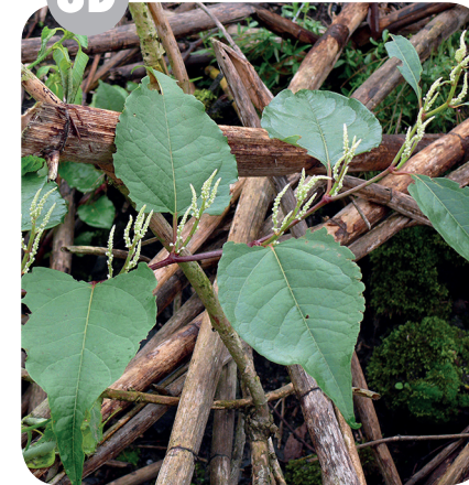
KŘÍDLATKA ČESKÁ ( Reynoutria bohemica ) Rdesnovité ( Polygonaceae )

Ruderalní stanoviště, podél vodních toků, komunikací a železnic.