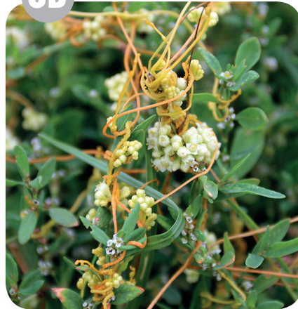
KOKOTICE LADNÍ ( Cuscuta campestris ) Kokoticovité ( Cuscutaceae )

Úhory, pole, polní cesty, hospodářské dvory, podél železničních tratí.