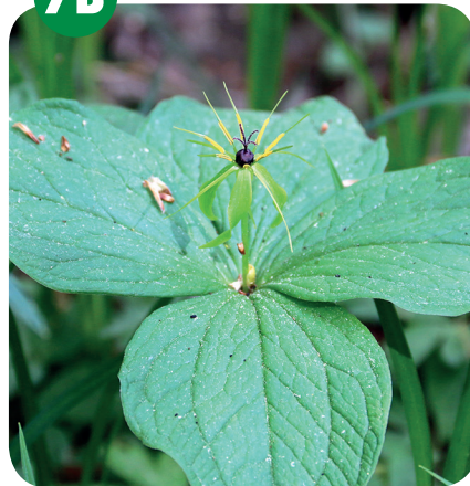
Vraní OKO ČTYŘLÍSTÉ ( Paris quadrifolia ) Triliovité ( Trilliaceae )

Vlhčí listnaté lesy, lužní a suťové lesy.