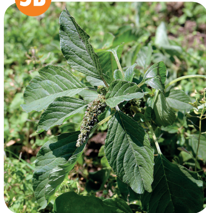
LASKAVEC HRUBOZEL ( Amaranthus blitum ) Laskavcovité ( Amaranthaceae )

Rumiště, skládky, návsi, okolo cest, u zdí, pole, zahrady, vinice, břehy řek, nádraží.