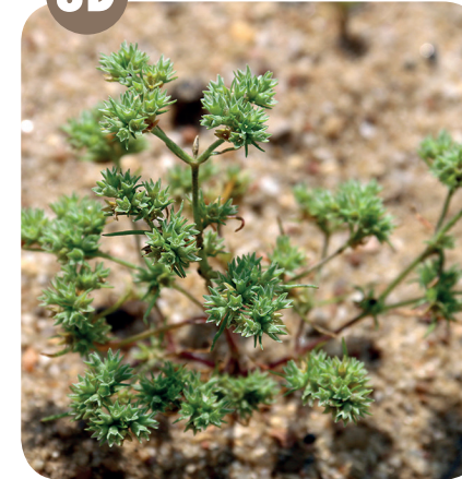
CHMEREK ROČNÍ ( Scleranthus annuus ) Hvozdíkovité ( Caryophyllaceae )