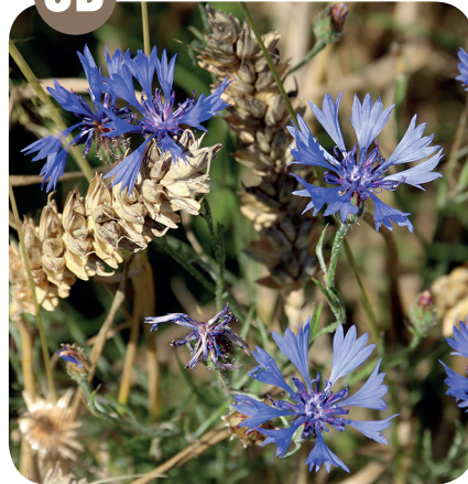
CHRPA MODRÁ ( Centaurea cyanus ) Hvězdicovité ( Asteraceae )