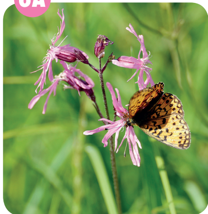
KOHOUTEK LUČNÍ ( Lychnis flos-cuculi ) Hvozdíkovité ( Caryophyllaceae )

Vlhké louky, příkopy, vlhčí lesní světliny.