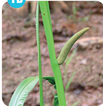
PUŠKVOREC OBEČNÝ ( Acorus calamus ) Áronovité ( Araceae )