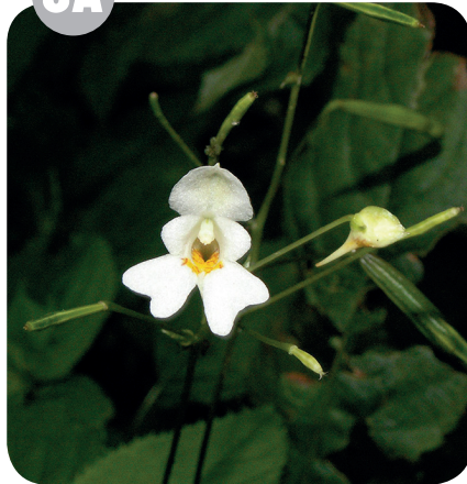
NETÝKAVKA MALOKVĚTÁ ( Impatiens parviflora ) Netýkavkovité ( Balsaminaceae )

Břehy řek a potoků, ruderalizované lesy, rumišťe, železniční náspy.