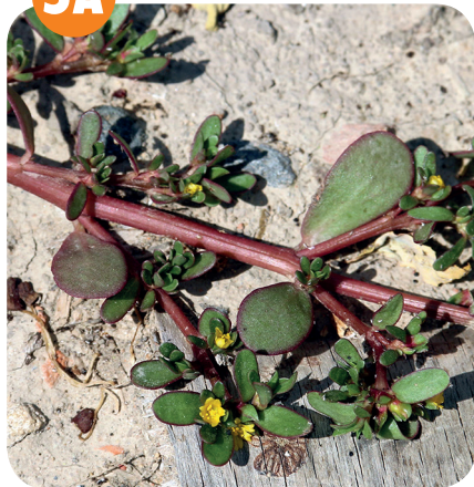
ŠRUCHA ZELNÁ ( Portulaca oleracea ) Šruchovité ( Portulacaceae )