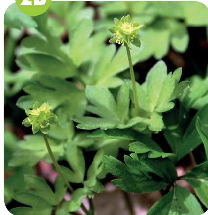
PIŽMOVKA MOŠUSOVÁ ( Adoxa moschatellina ) Pižmovkovité ( Adoxaceae )

Lužní lesy, břehy řek a potoků, stinné rokle.