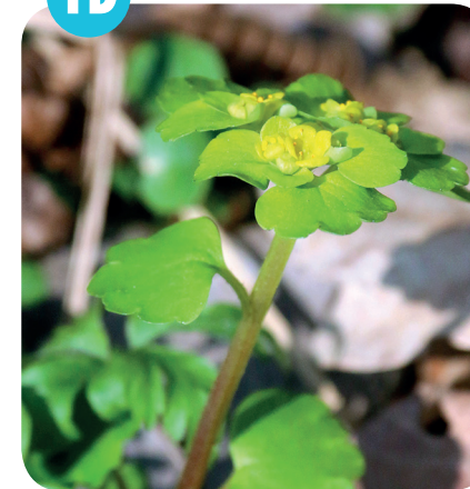
MOKŘÝŠ STŘÍDAVOLISTÝ ( Chrysosplenium alternifolium ) Lomikamenovité ( Saxifragaceae )

Lesní prameniště, olšiny, luhy, břehy toků.