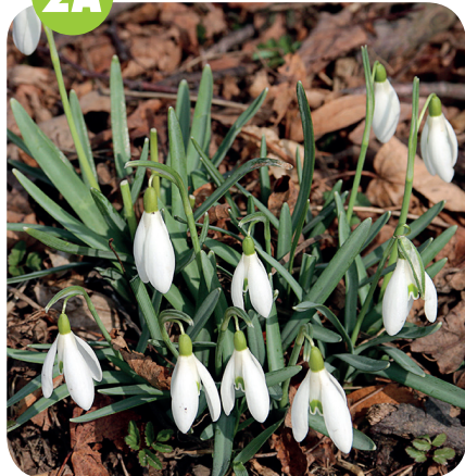
SNĚŽENKA PODSNĚŽNÍK ( Galanthus nivalis ) Amarylkovité ( Amaryllidaceae )

Lužní lesy, křoviny, humózní listnaté lesy.