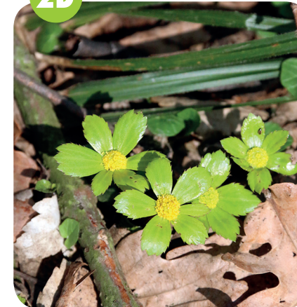
HVĚZDNATEC ZUBATÝ ( Hacquetia epipactis ) Mířikovité ( Apiaceae )