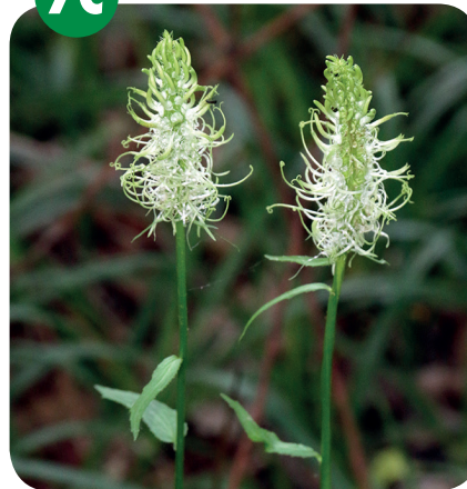
ZVONEČNÍK KLASNATÝ ( Phyteuma spicatum ) Zvonkovité ( Campanulaceae )