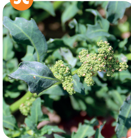
MERLÍK SIVÝ ( Chenopodium glaucum ) Merlíkovité ( Chenopodiaceae )

Obnažená dna, ruderální stanoviště, zasolené substráty.