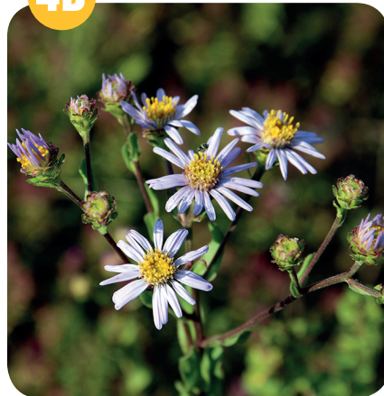
HVĚZDNICE CHLUMNÍ ( Aster amellus ) Hvězdicovité ( Asteraceae )

Křovinaté stráně, lesní okraje, skály, lesostepi.